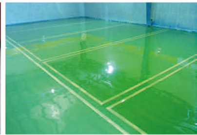
Special Coatings For Concrete Floors